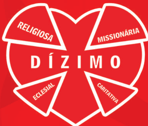
Pastoral do Dízimo