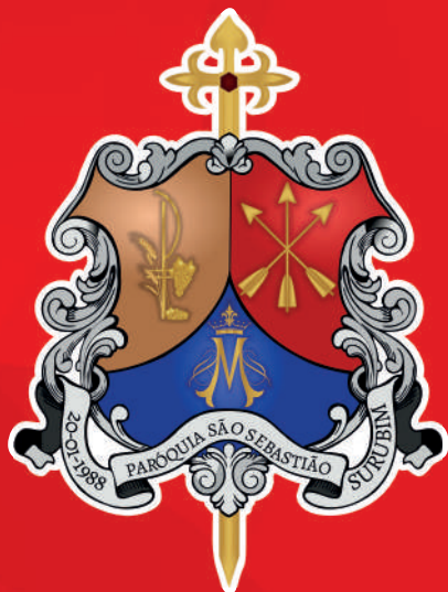
Paróquia São Sebastião Surubim-PE